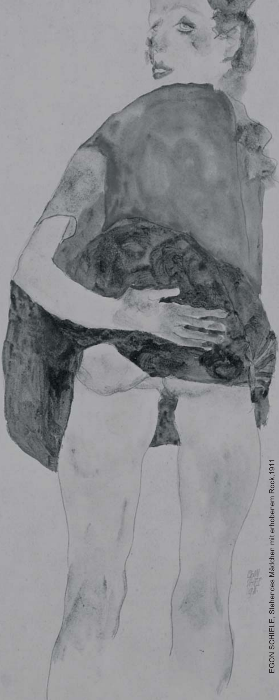
EGON SCHIELE, Stehendes Mädchen mit erhobenem Rock, 1911